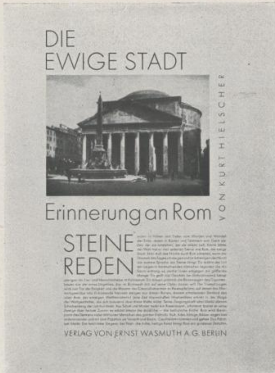
HEINRICH JOST Blatt aus der „Futura“-Schriftprobe A Page of the Type Sample „Futura“

aus seinem Inhalt zu ergeben scheint, desto besser ist sie. Und je schwerwiegender der literarische Inhalt eines Buches ist, desto feineres typographisches Taktgefühl setzt seine Formgestaltung voraus. Die wichtigsten Aufgaben der Typographie verlangen also die bescheidenste Form, und gerade zur Anerkennung solcher ebenso nötiger wie schwerer Selbstbeschränkung fehlt den Fernerstehenden in der Regel das rechte Verständnis. Es kostet dem Typographen oft genug viel Überwindung, aus einer Reihe reizvoller Entwürfe für die Gestaltung eines Buches zum Schluß doch die anspruchsloseste zur Ausführung zu wählen.