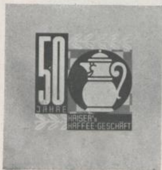
Siegelmarke Poster Stamp