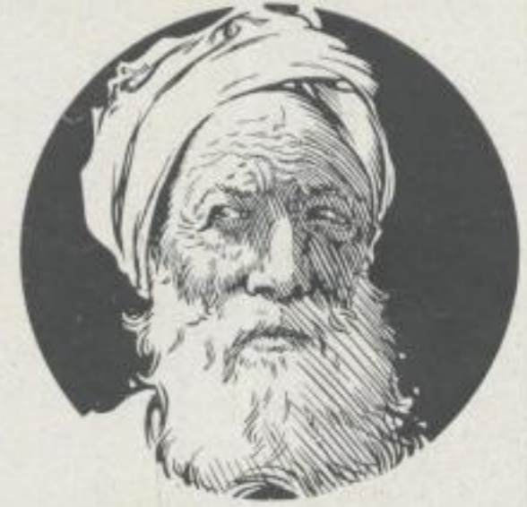
Illustrationen A. A. Ritscher-Bremen

All diese Imponderabilien geben der Schiffahrtpropaganda von vornherein Inhalt und Richtung, sie beengen zwar die Freiheit des Handelns, ohne jedoch dem Erfolge Abbruch tun zu können.