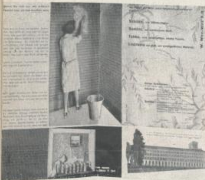
Prospektinnenseiten Inside Pages of a Folder