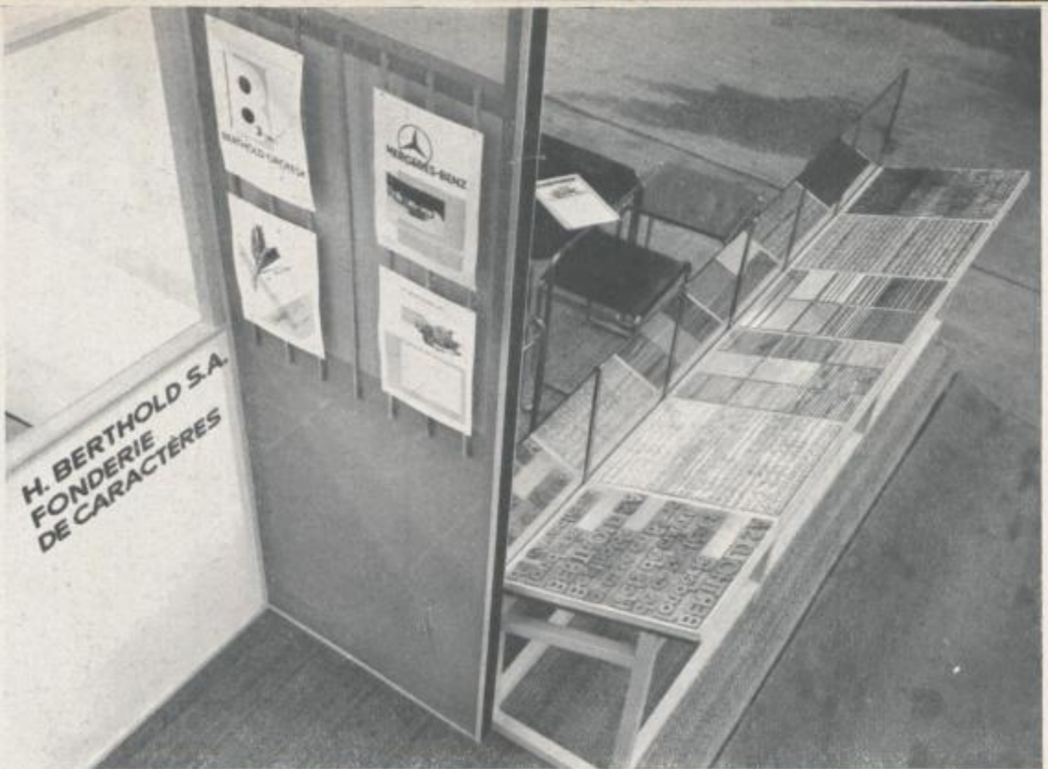
Ausstellungsstand in der Deutschen Kunstgewerbeausstellung in Berlin

Großes Interesse erregte die deutsche kunstgewerbliche Ausstellung in Paris, deren Katalog und ein großer Teil der Raumgestaltungen von Herbert Bayer geschaffen wurden. Raum und Ausstellungsgut ist so geschickt zusammenkomponiert, daß immer eine geschlossene sehr interessante Wirkung entsteht, ohne daß die Gesamtwirkung das Eigenleben der ausgestellten Gegenstände beeinträchtigt.