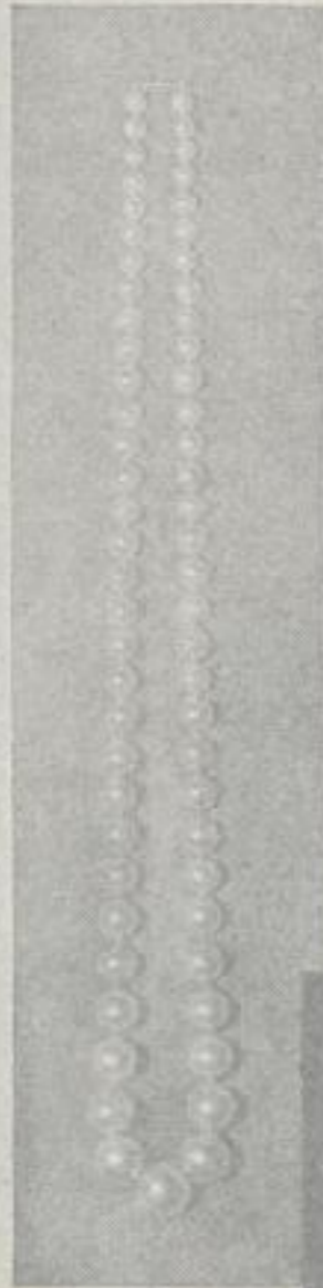
Photographische Wiedergabe eines Ciro Kollars (40 cm lang) komplett mit Goldschloß u. St. RM 21,-

Besuchen Sie die Ciro Salons, Wählen Sie das Schmuckstück, dessen Schönheit die Gewähr einschließt, die Empfängerin zu erfreuen. Schenken Sie mit geringen Kosten ein Collier aus Ciro Perlen, Sie werden einen langgehegten Wunsch erfüllen.