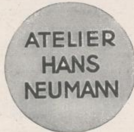
WIEN I. STOCK IM EISENPLATZ 3-4 TELEFON R 23-2-29