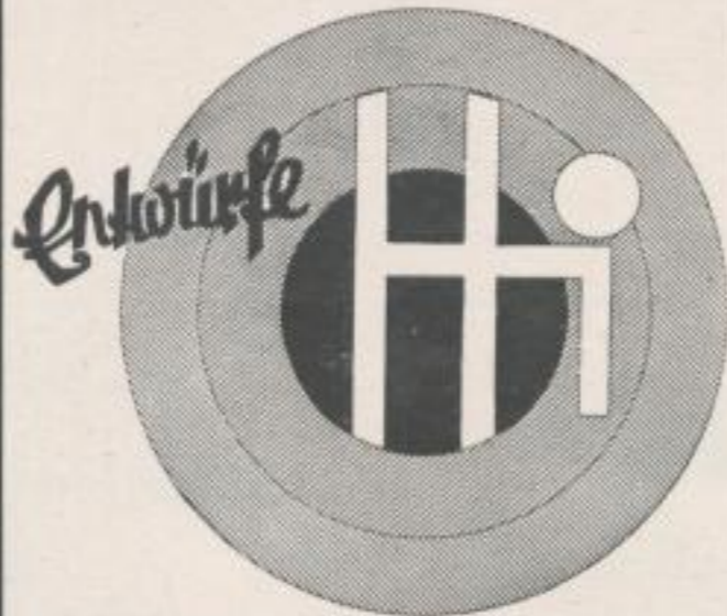
Rud. Hildebrandt Dresden-A. 1 Kaulbadstr. 15