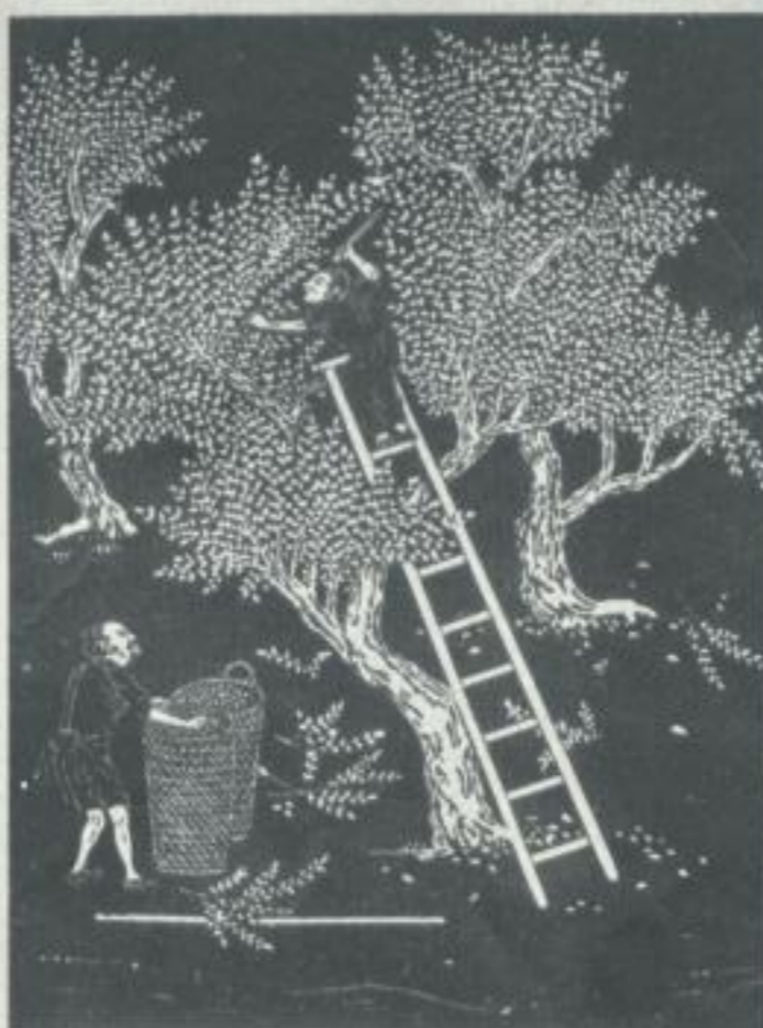
QUARTELLENS EINES YONGENLOS AUS DER BEIDINGSKINNING (ANWÄSEN DER MAJLREDBAUWEISE) Entnommen aus dem über die Stärke und Schwäche der chinesischen Wirtschaft (Kung-Chih-Fu), das unter dem Namen 'China' (1907) im Verlag von... erschienen ist.

Unter allen Kulturstaaten der Welt ist China der einzige, der bis heute seinen jahreslangen Bestand bewahrt hat. Die Bodenfläche des eigentlichen Chinas streift nur das Zehnteile des Deutschen Reiches, während die Schätzungen seiner Einwohnerzahl zwischen 300 und 450 Millionen schwanken.