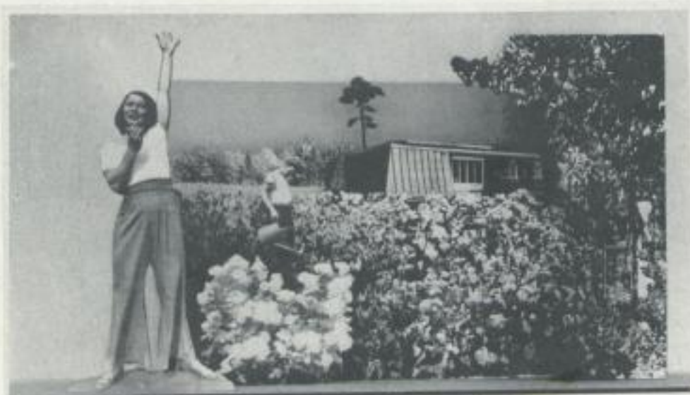
Auf eigenem Boden steh'n wir nun und lassen alle Sorgen ruhn!