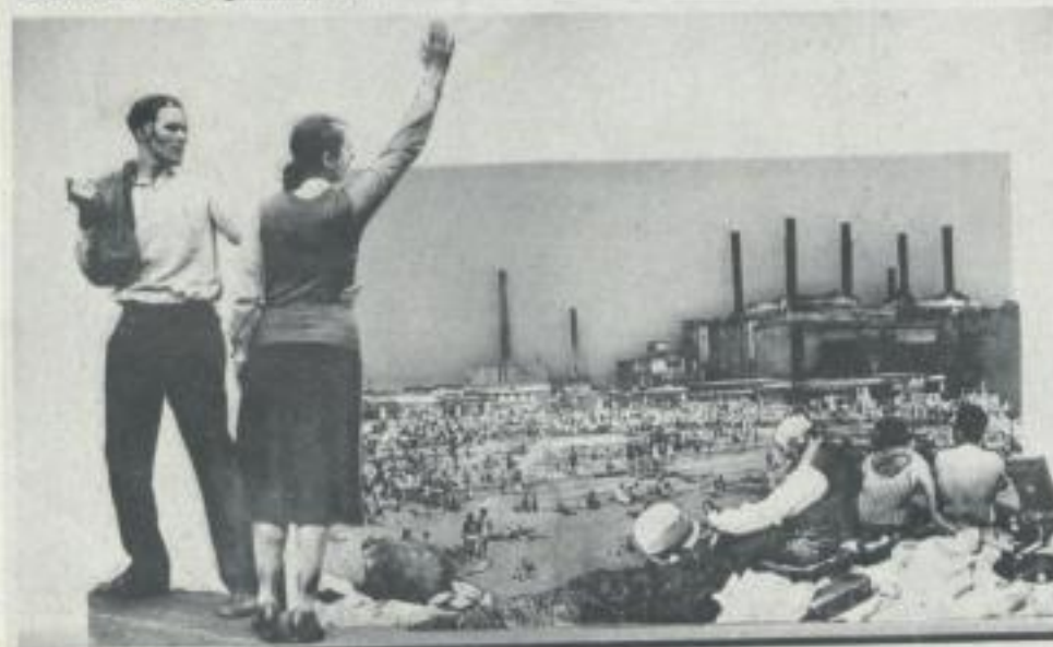
Lass die Mietskasernen baden!