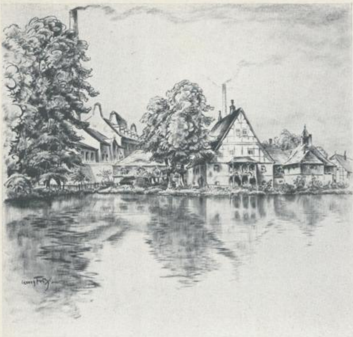
Alte Papiermühle und Halbzeuganlage