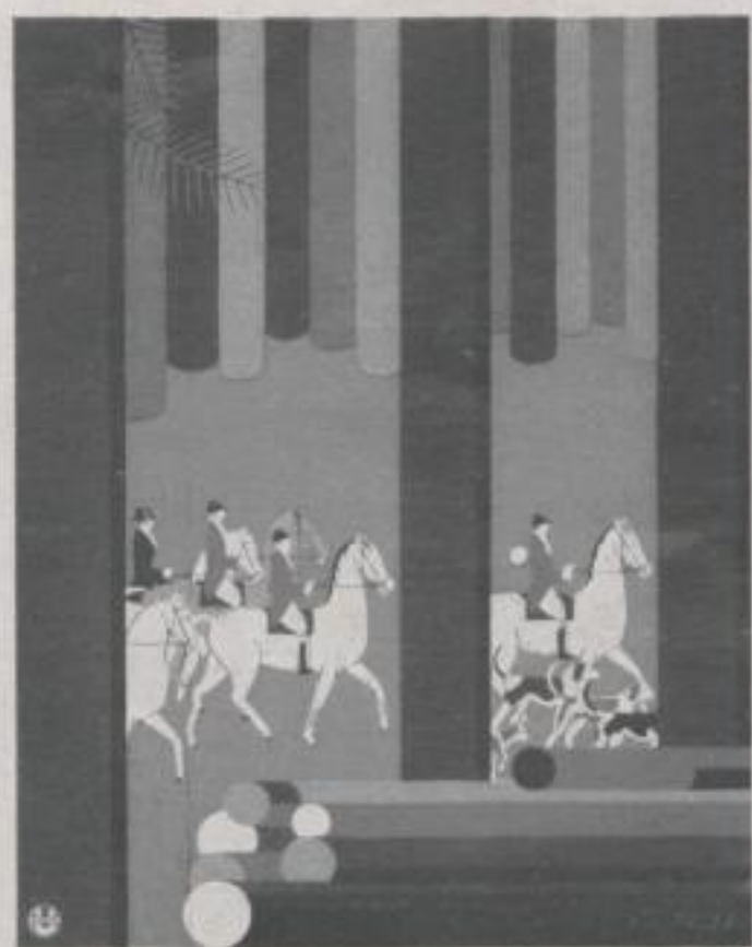
Hubertus Jagd 1931