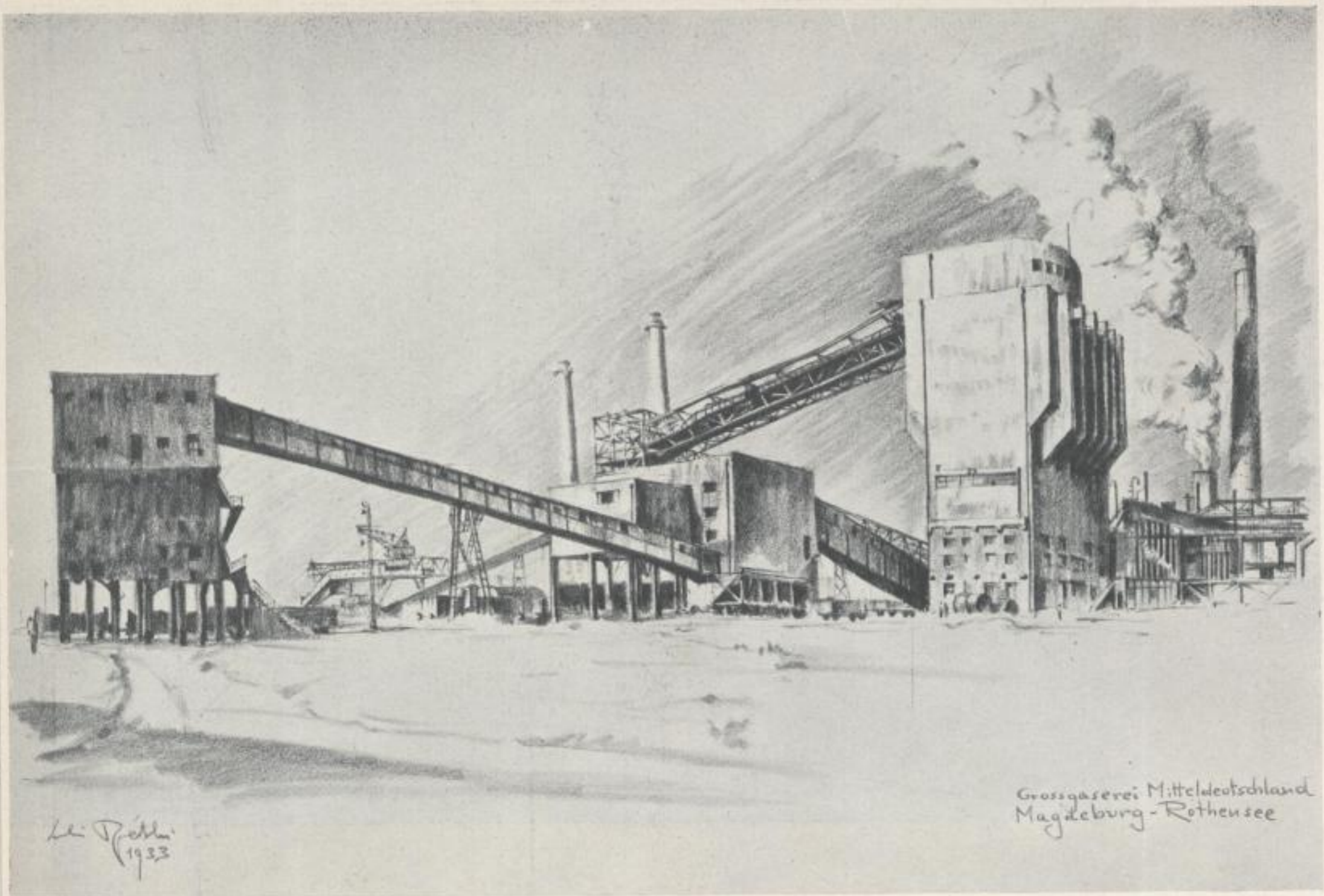
Großgaserei Mitteldeutschland Magdeburg-Rothensee