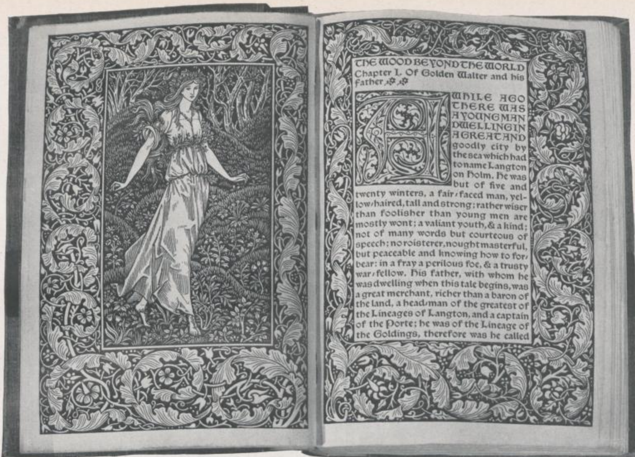
„The Wood beyond the World“ von William Morris, von ihm auf der Kelmscott Press gedruckt. Abgeschlossen am 30. Mai 1894.