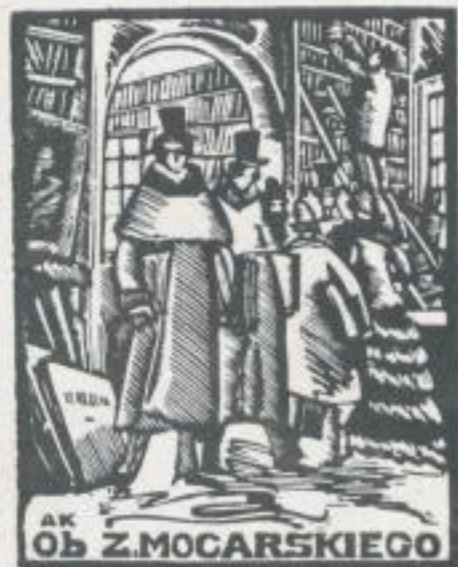
Ex Libris und illustrative Holzschnitte