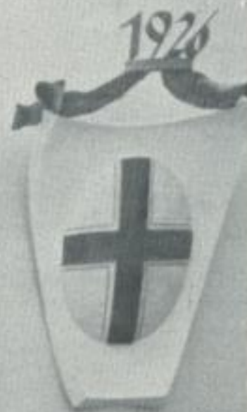
MAILAND 1926 INTERNAT. STRASSENKONGRESS