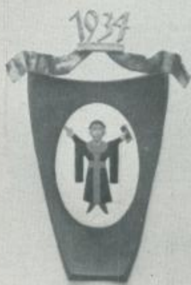
MÜNCHEN 1934 INTERNAT. STRASSENKONGRESS