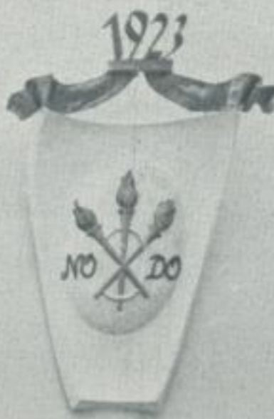
SEVILLA 1923 INTERNAT. STRASSENKONGRESS