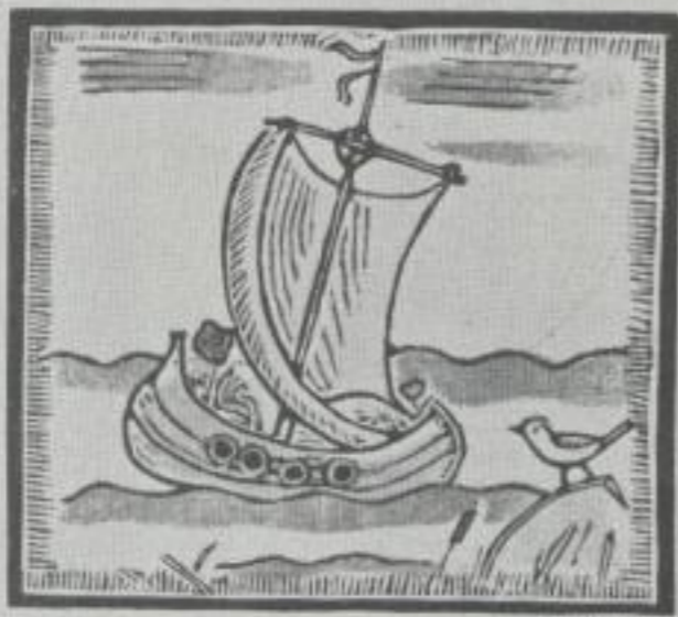
Fleur de Coquelicot, l'Orgueilleuse

Holzschnitte für „Fleur de Coquelicot l'Orgueilleuse“ (Die hochmütige Klatschrose), Verlag Librairie Fischbacher. Aus der Internationalen Kinderbuch- Ausstellung der Librairie Fischbacher, Paris