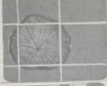
Sägebänder schneiden das Rund des Stammes