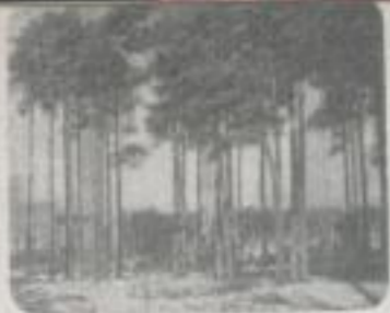
Der Wald The forest