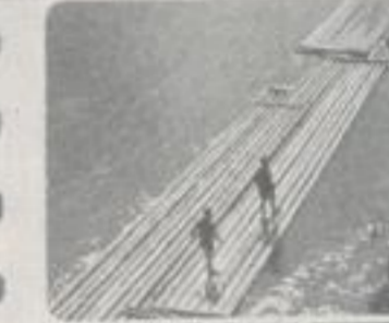
Stamm an Stamm gebunden — log bound to log