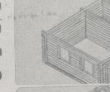
Balkenlage auf Balkenlage, The planks form walls,