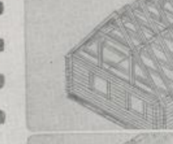
das festgefügte Viereck wächst the solidly built rectangle becomes