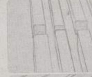
Streng geordnet schichtet sich Balken über Balken which are laid one on another