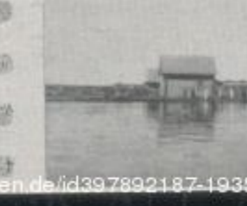
heute noch wie vor 2000 Jahren das typische Bauern- haus des Ostens To-day as it was 2000 years ago, the typical peasant's hut of Eastern Germany