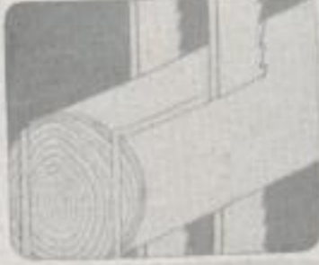
Ribbon blades saw the round trunk