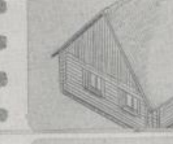
zum Blockhaus — a log-hut —