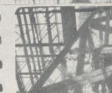
Fachwerk verliert letzte Schwere becomes implicit with lightness and grace