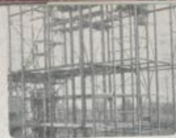
Fachwerk baut Wolkenkratzer Framework forms skyscrapers