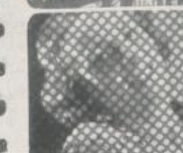
Fachwerk wird luftiges Gespinst becomes frail latticework