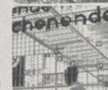
Fachwerk wird Stahlskelett becomes a skeleton of steel