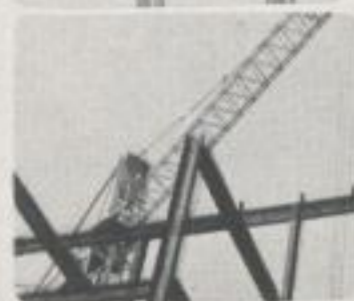
Türme stürzen — Towers fall —