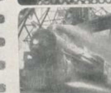
Fachwerk verwandelt die Welt changes the world