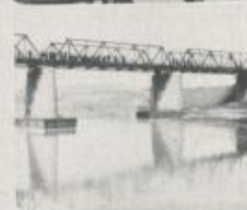
— werden zu Brücken become bridges