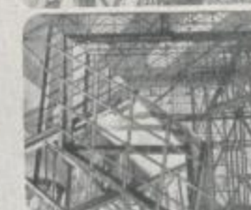
Fachwerk schafft Werkhallen creates factories