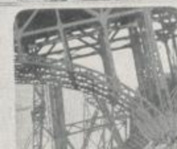
Fachwerk spannt sich in Brücken spans space in bridges