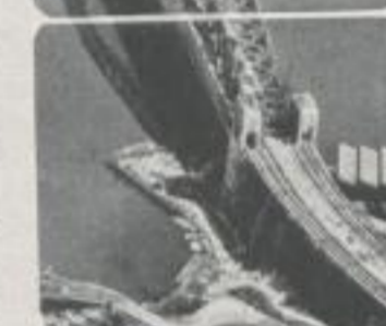
Framework, a mo- ment ago, soaring upwards, now spans space