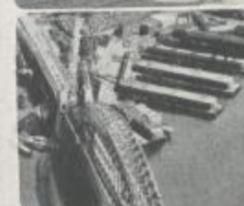
Fachwerk, das eben noch die Höhe er- klimm, überspannt jetzt die Weite