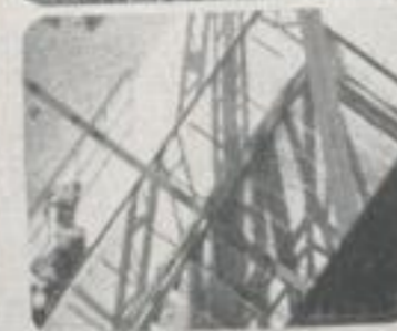
Fachwerk erhebt sich in Türmen rises in towers