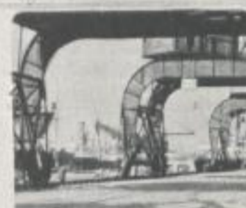
Fachwerk liegt als Gitterträger über Brückenpfeilern Framework rests on bridge piers in the form of girders