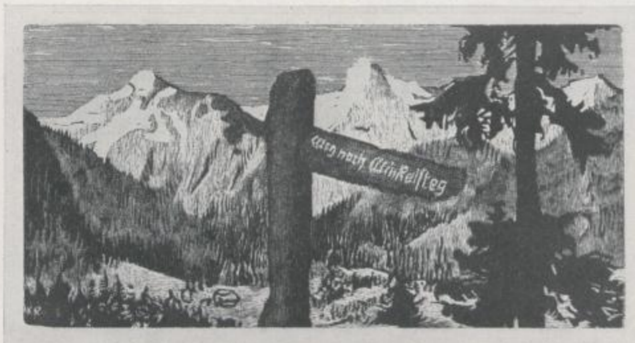
Aus Rosegger „Schriften des Waldschulmeisters“