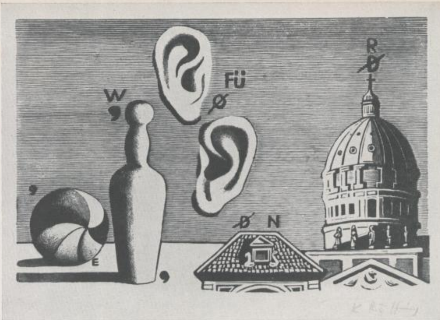
Aus „Bilderrätsel in Holzstichen“ Inselbücherei Nr. 219