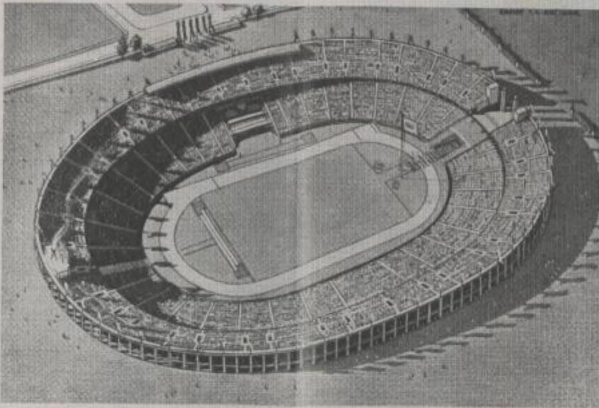
O Estádio Olímpico Alemão no Campo Esportivo da Reich