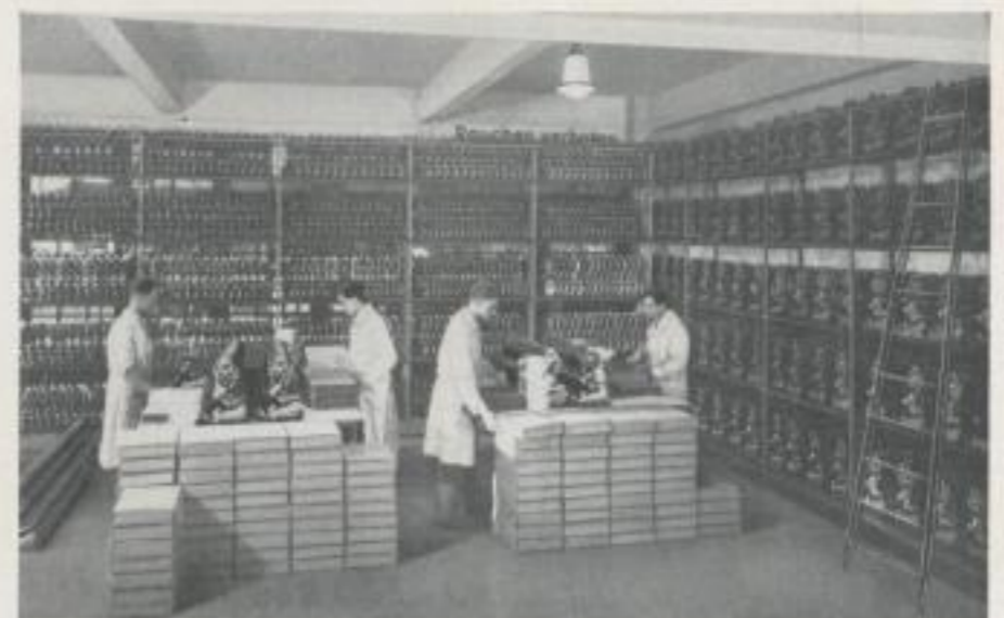
1200 SAROTTI-MOHREN IN DER EXPEDITION