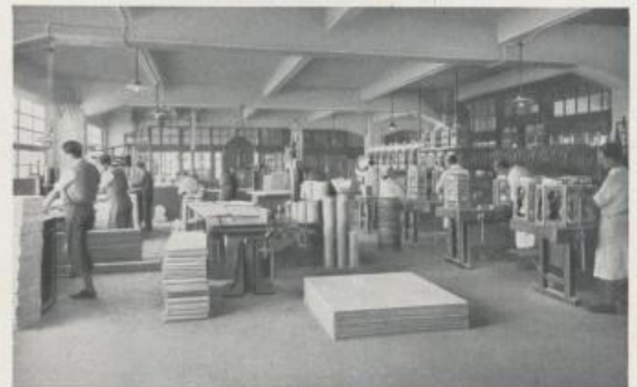
BLICK IN UNSERE SPEZIAL-SCHREINEREI