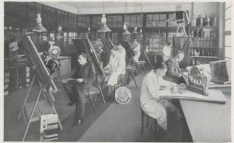
UNSER ENTWURFS-ATELIER BEI DER ARBEIT