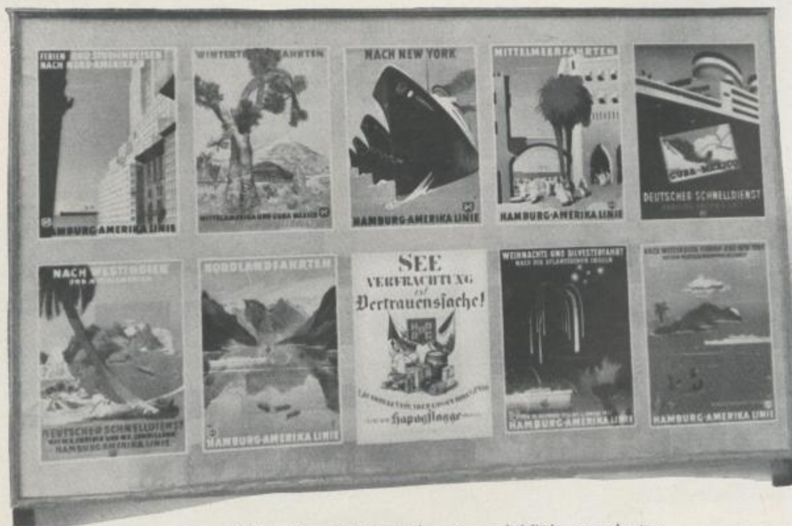
Dekorative Plakatwände mit vorbildlich geordnetem Anschlag standen auf dem Freigelände der Ausstellung. Decorative bill-sticking hoardings with well-arranged posters stood in the Exhibition grounds.