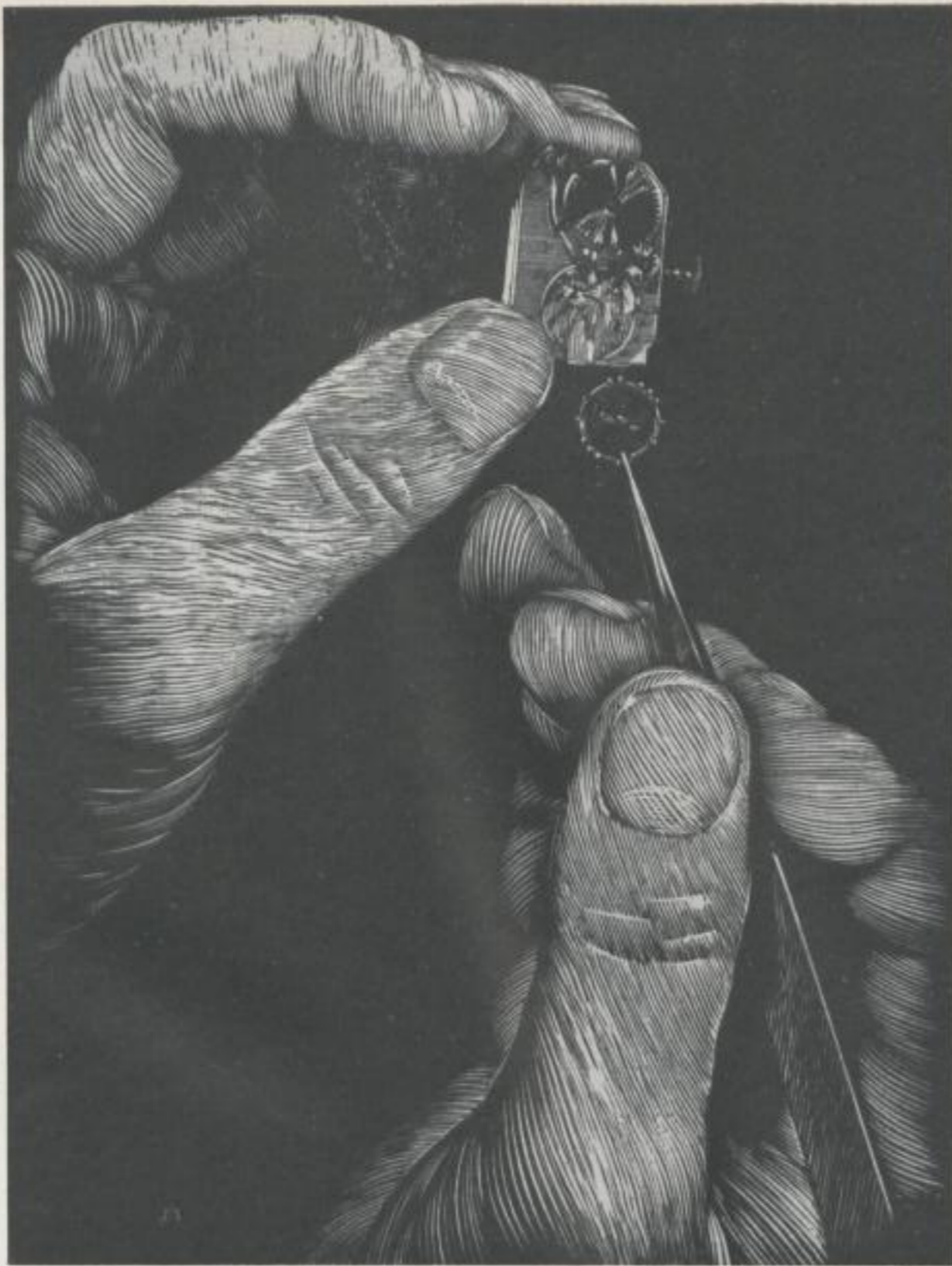
Holzstiche aus einem Prospekt der Glashütter Uhrenindustrie