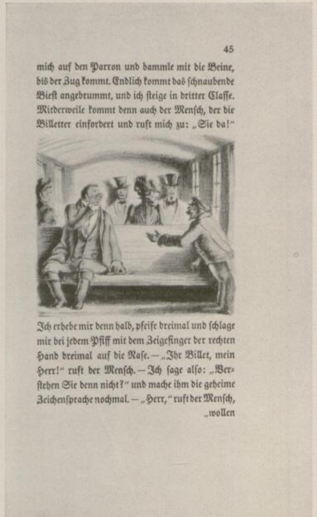
Buchillustrationen aus Fritz Reuters „Inspektor Bräsig“

„Sie haben Recht,“ sagt er, „aber Sie haben sich weiß gemacht,“ und stellt sich hinter mir und klopft mir bößlich den Puckel ab. „Indessen,“ sagt er, „for gewöhnliche Generals wird auf Postamenten kein Pferd gut gethan, das is bloß for die allerhöchsten Herrschaften, wie Sie das an den ollen Früh