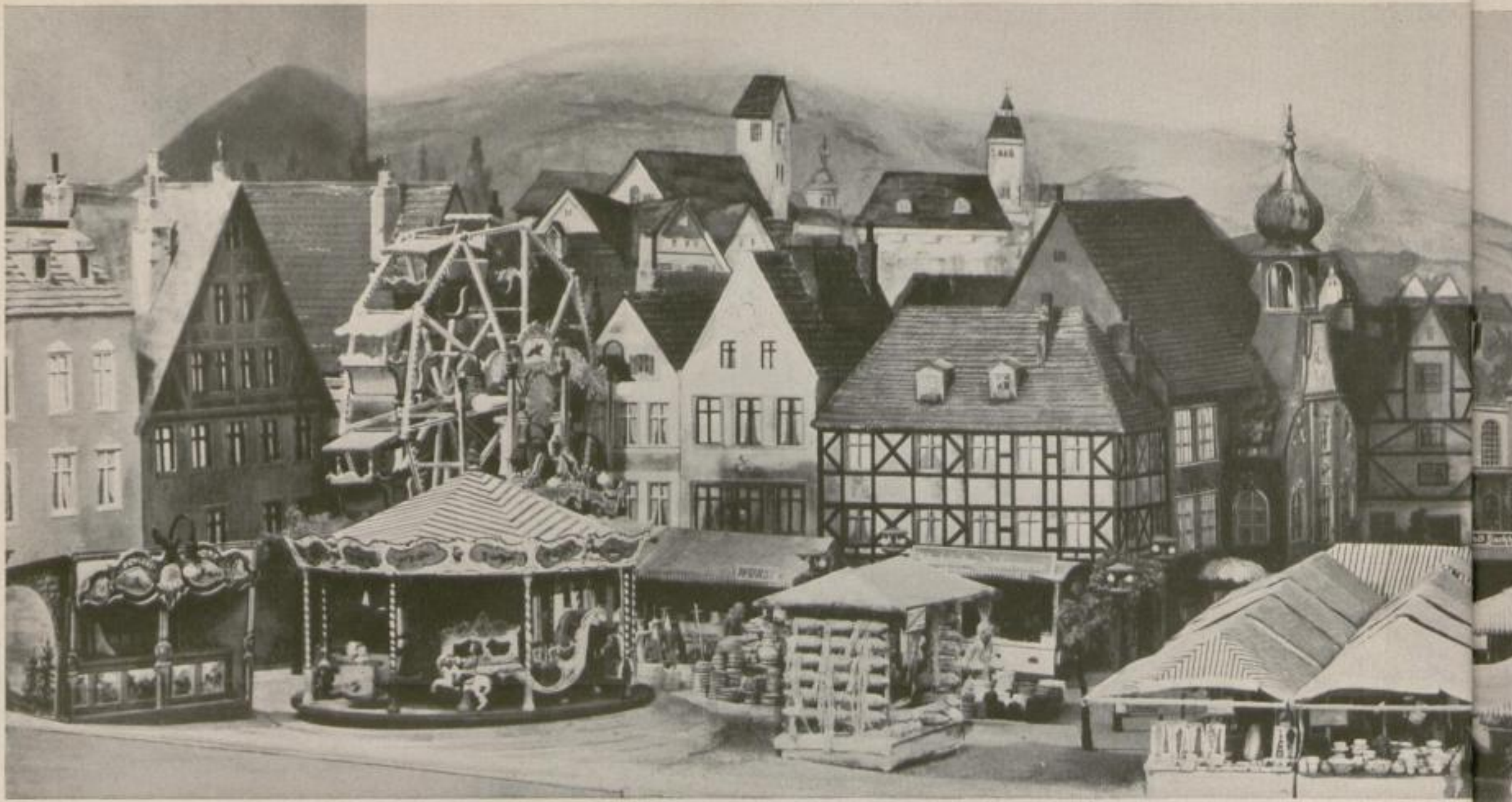
Teilausschnitt aus dem Ausstellungsstand: Der Jahrmarkt von Kulmbach