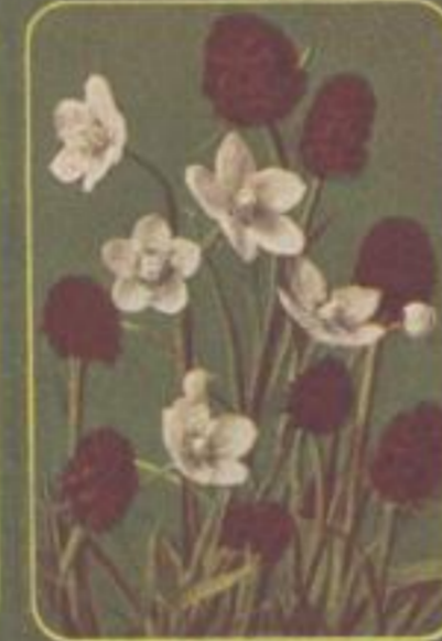
Studentenblümchen ( Mimulus )