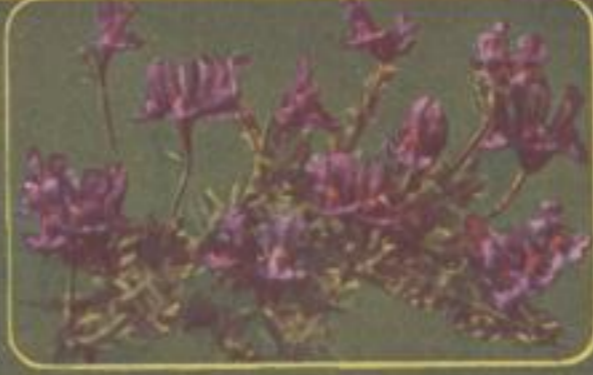
Alpen-Leinkraut ( Livaria alpina )