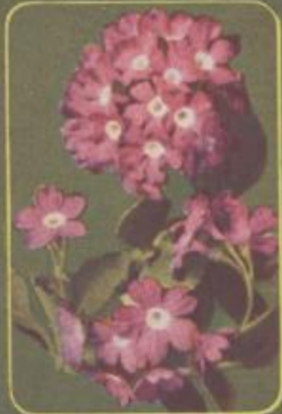
Behaarte Primel ( Primula hirsuta )