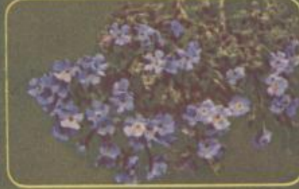
* Himmelsherold ( Eitrichium nanum )