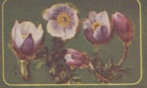
Frühlings-Anemone ( Anemone vernalis )