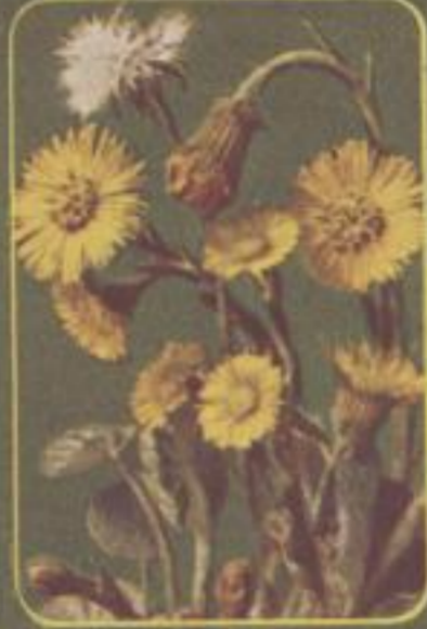
Gelber Hufschuh ( Tussilago farfara )