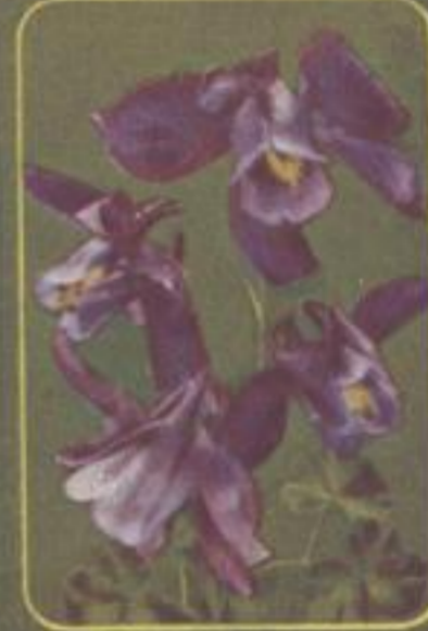
* Alpen-Aklat ( Aquilegia alpina )