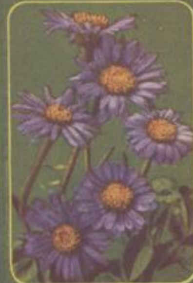
Alpen-Aster ( Aster alpinus )