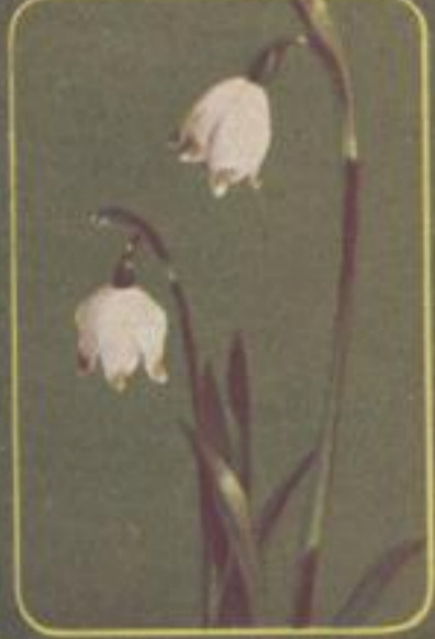
Großes Schneeglöckchen ( Luzula )

Dieser Sommerprospekt von St. Moritz ist in Bild und Argumentation musterhaft. In glücklich gefundener Natürlichkeit wird auf dem Titelbild weder Luxus noch Eleganz zur Darstellung gebracht. Zur Überraschung des Beschauers bringt es vierzig Bergblumen des Engadins. Das ist eine „unerwartete Wendung“, die gefangennimmt! Liebevoll wandert die Neugier von einer Blüte zur anderen, man ist eingefangen und gern bereit, sich mit den weiteren Ausführungen des Prospektes zu beschäftigen.