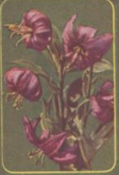
Türkenschuh-Lilie ( Lilium martagon )