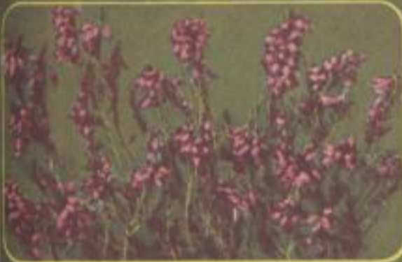
Felschafblühes Heidekraut ( Erica carnea )