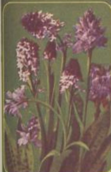
Engadiner Knabenkraut ( Cephalopogon )