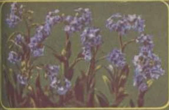
Open-Vergilbweinsicht ( Myosotis alpestris )