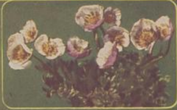
Gletscherhahnenfuß ( Ranunculus glacialis )