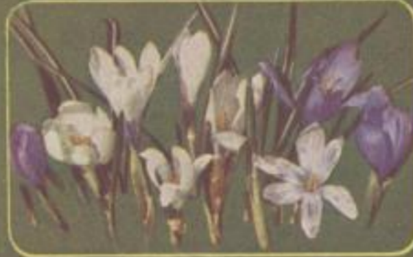
Frühlings-Krokus ( Crocus vernus )