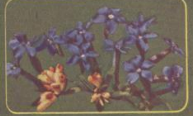
Frühlings-Enzian ( Gentiana verna ) Immergrüne Krenoblüme ( Poligala chamaebuxus )