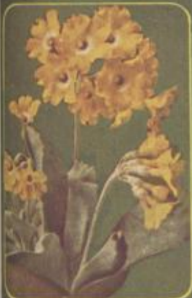
Felsen-Aurikel ( Primula auricula )