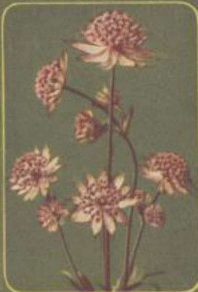
Großer Talstern ( Astrantia major )