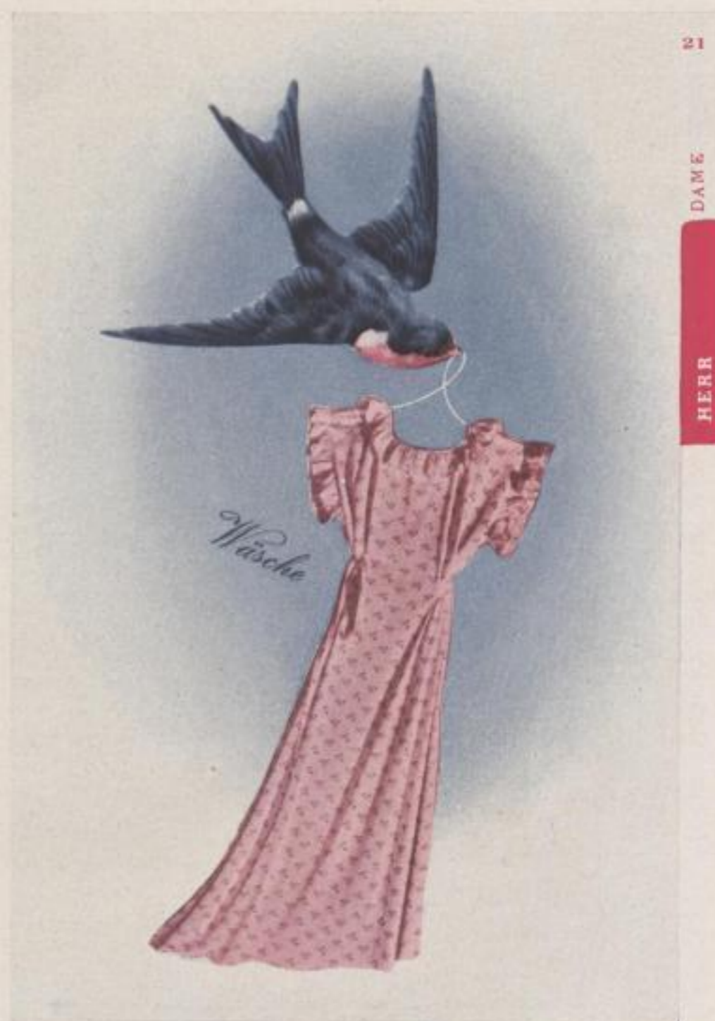
Page from a pamphlet for artificial silk

It would not be at all uninteresting to circulate an enquiry among advertising artists and find out how they came to choose their vocation, and in particular to learn whether their decision to adopt the profession of advertising art—which as a matter of fact has only of recent years been able to count among its members creative artists of note—was due to inclination, economic reasons or to mere accident. On broaching the subject to Herbert Bayer whose new series of work is