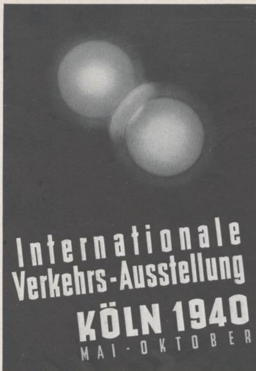
II. PREIS 2nd AWARD Entwurf PAUL LÄMMEL Design