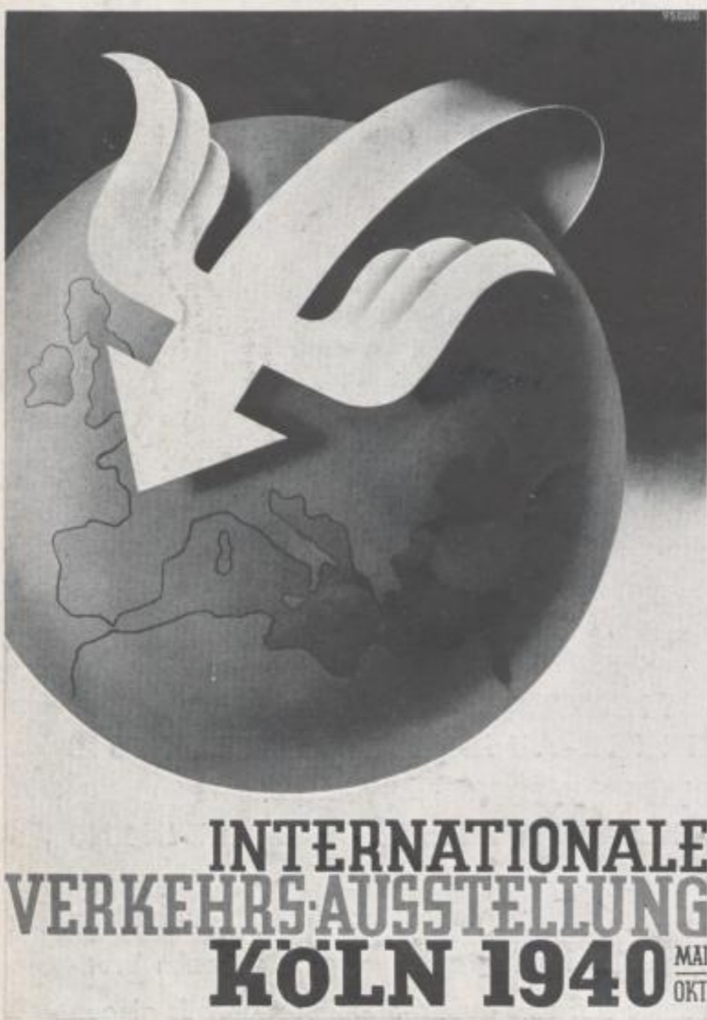
Entwurf WILLI FALTIN Design

über 1000 Plakatentwürfe ein, die dann anschließend zu einer großen Plakatschau zusammengefaßt wurden, um auch der Öffentlichkeit Gelegenheit zu geben, sich über das Schaffen der deutschen Graphiker und vornehmlich der jüngeren Fachkräfte zu unterrichten.