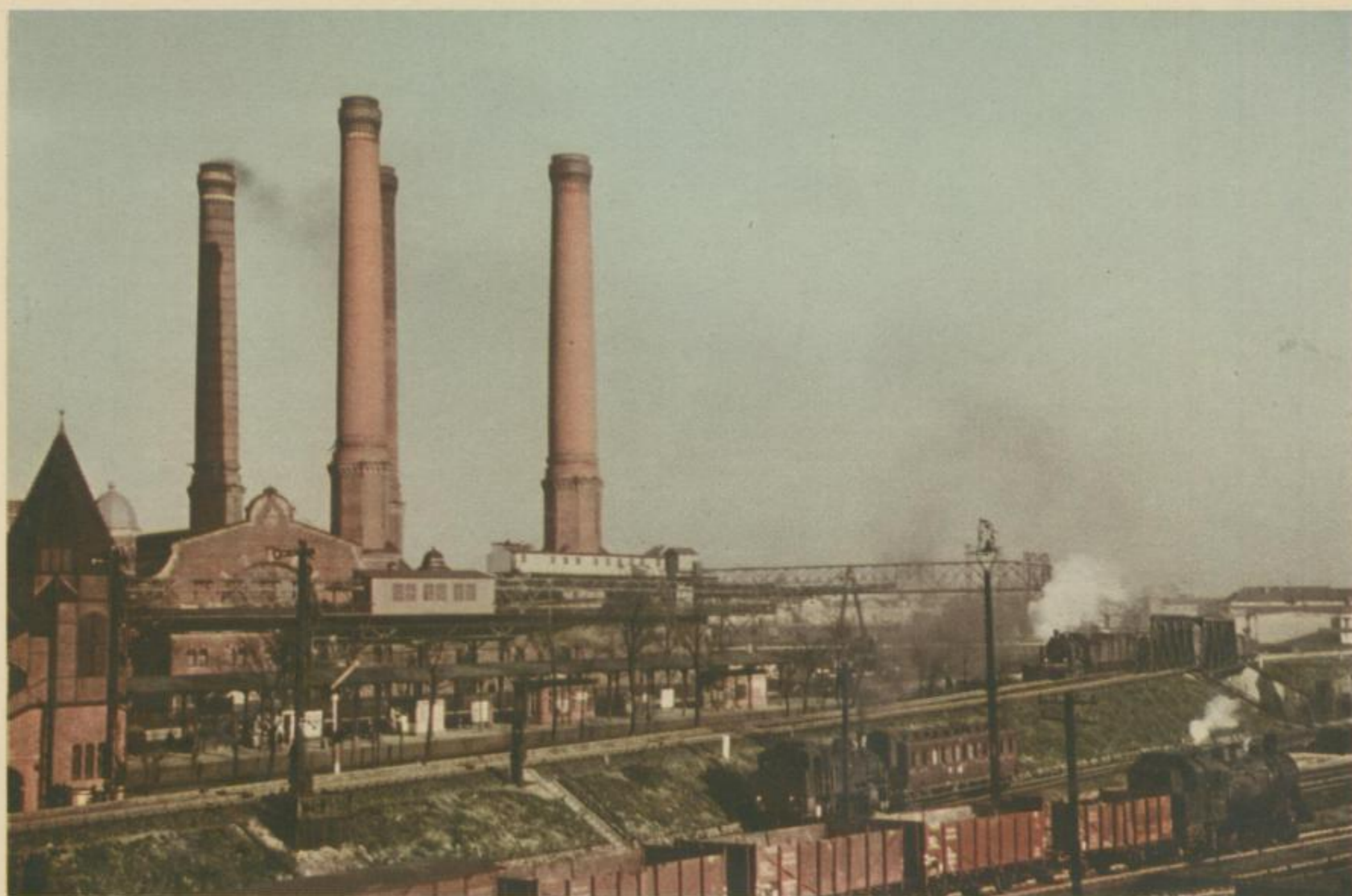
Berlin, Kraftwerk Puffitzstraße