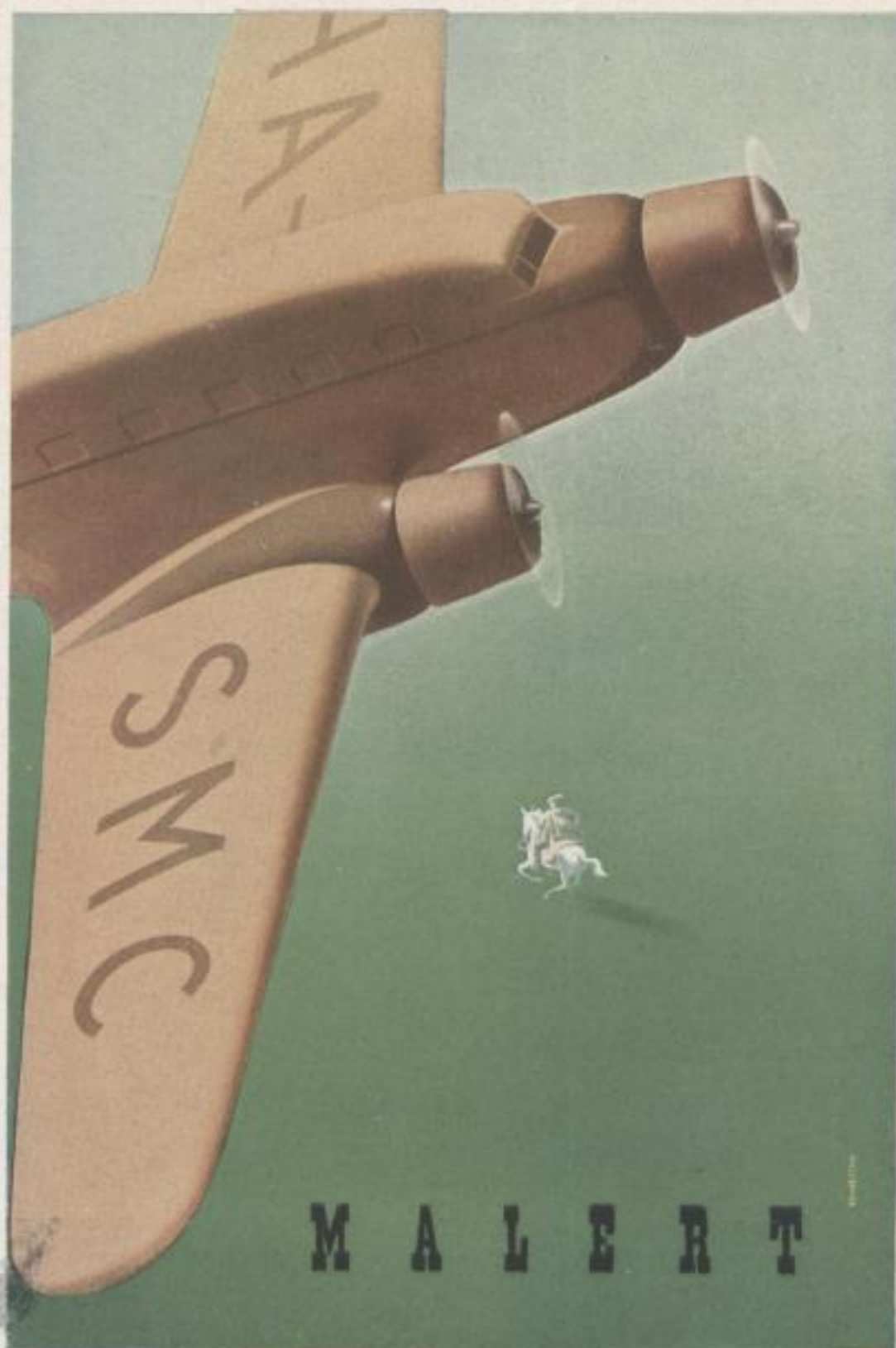
Plakat für die ungarische Flugverkehrsgesellschaft Poster for the Hungarian Airways

graphik führten. Konecsni ist ein zurückhaltender, bescheidener, wenn auch ein sich seiner Fähigkeiten durchaus bewußter Künstler, dem es im übrigen nicht weiter schwer fiel, sich die führende Stellung unter den Werbegraphikern Ungarns zu sichern. Seine Arbeiten, mit denen er an die Öffentlichkeit trat, sind gründlich durchdacht, durchgefeilt und ihrer ganzen Ausführung nach von einer viel-sagenden Einfachheit. Er hat einen sehr charakteristischen Stil: welches seiner Plakate man auch immer betrachtet, sie sind voneinander oft recht verschieden, aber dennoch alle ausgesprochene Konecsnis. Er verfügt über einen ganz hervor-