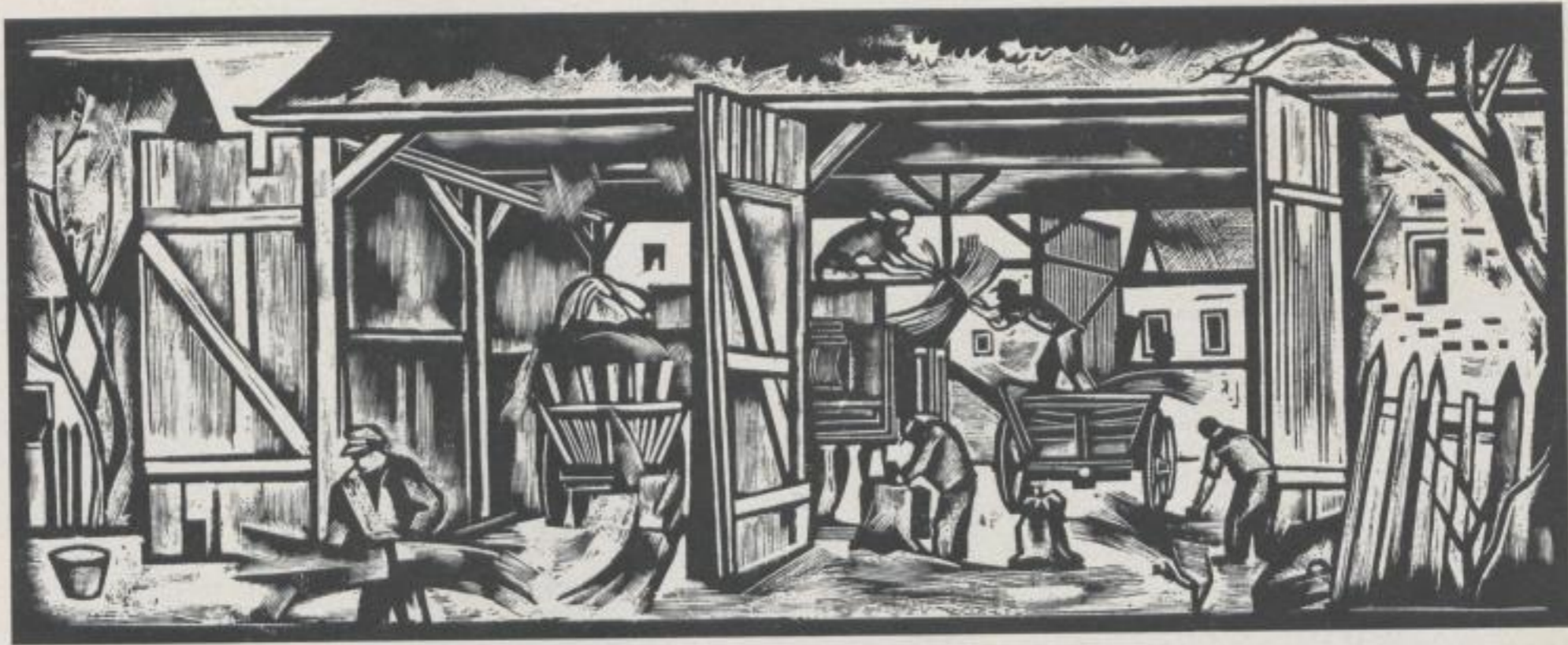
„Dezember“ Kopfleiste aus einem Kalender.