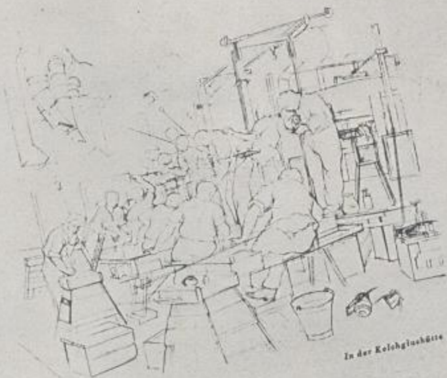
In der Kelchglashütte

Wir verlassen diese Hütte, weil unser Meister uns noch zu den Kelchmachern führen will, denn hier wird nur Hohlglas geblasen. Nur der Glasmacher trennt das Hohlglas von den Kelehen, gemeinhin nennt man alles Hohlglas, was geblasen wird, im Gegensatz zu dem Spiegelglas. Unser Maler kann sich kaum losreißen, so begeistert ist er immer noch von dem Bild. Er muß auch noch sehen, wie eine ganz große Vase geblasen wird. Hierzu gehört Lungenkraft ebenso wie Kraft und Geschicklichkeit der Arme. Im Geist skizziert er den