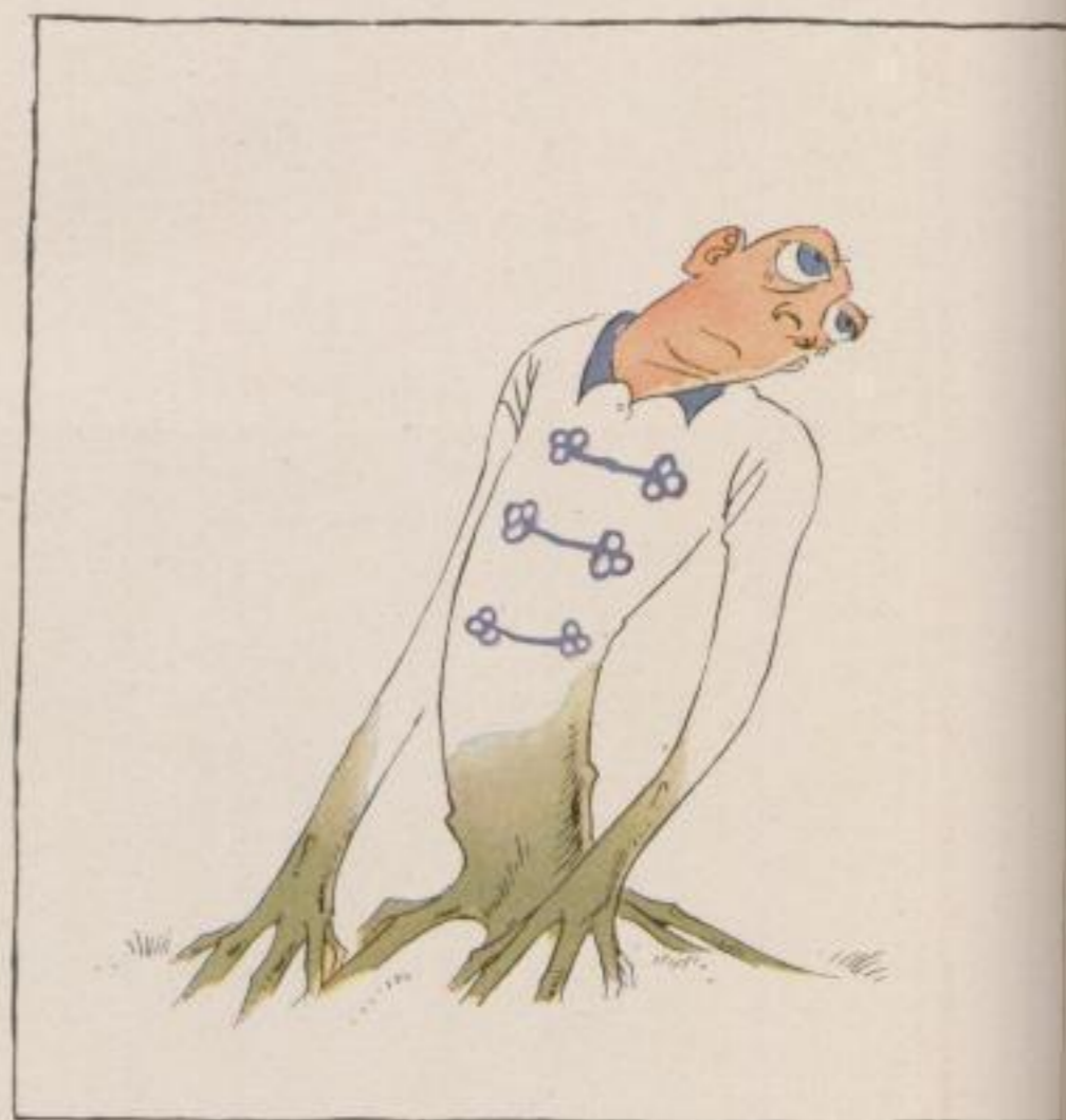
tegen zoo'n gevoel dat de dokter „influenza“ en ik „een op- komend griepje“ noem .....