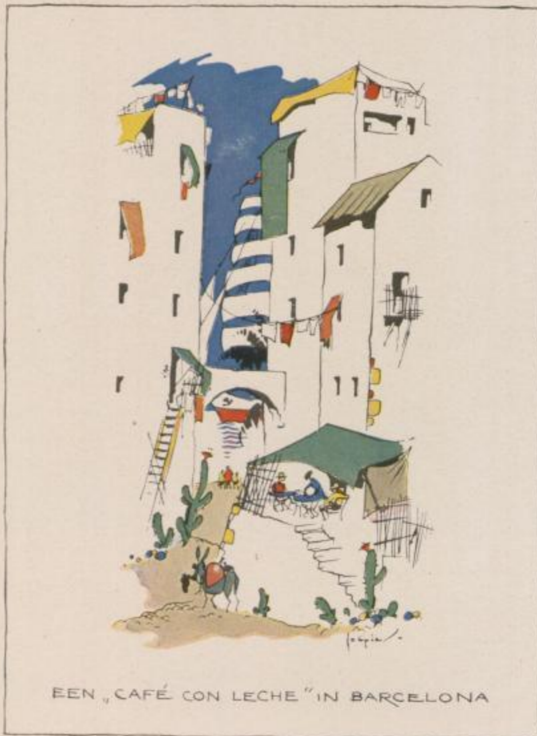
EEN „CAFÉ CON LECHE“ IN BARCELONA