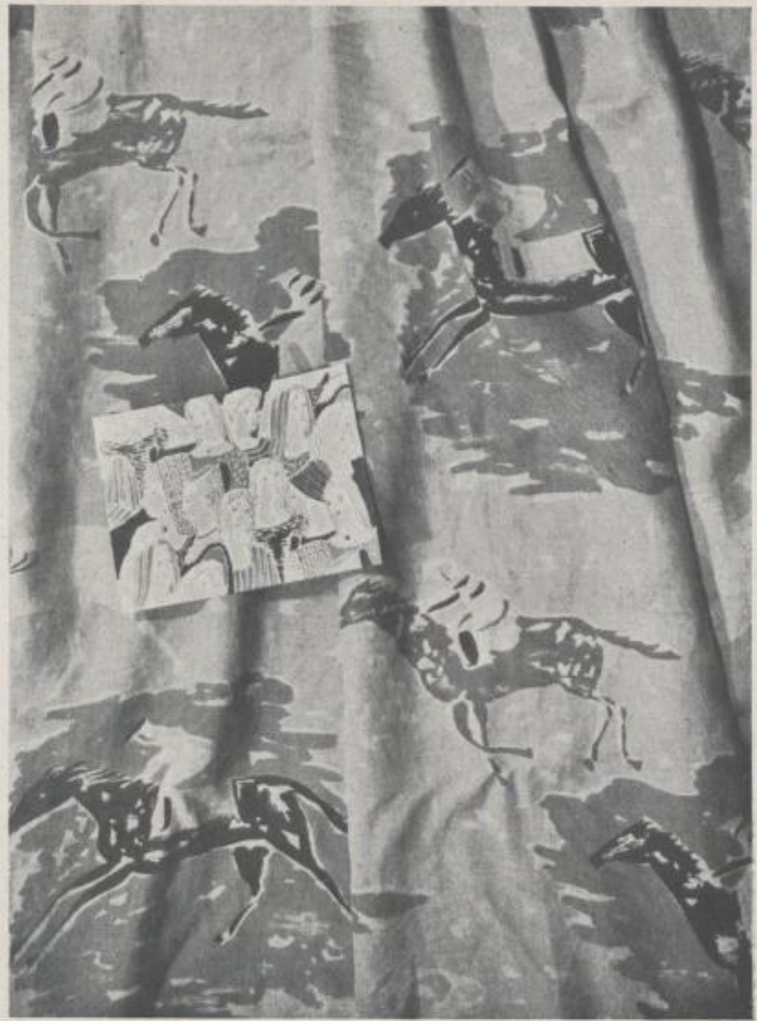
Zeitschriftenumschlag Periodical Cover