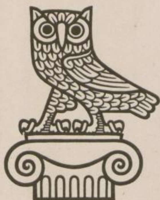
Marke Trade Mark