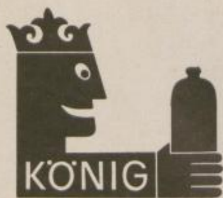
Schutzmarke Trade Mark