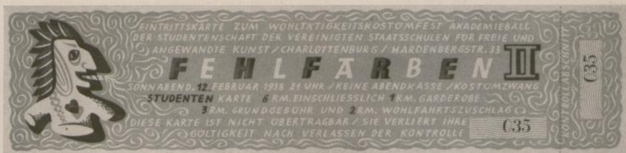
Eintrittskarten für einen Künstlerball