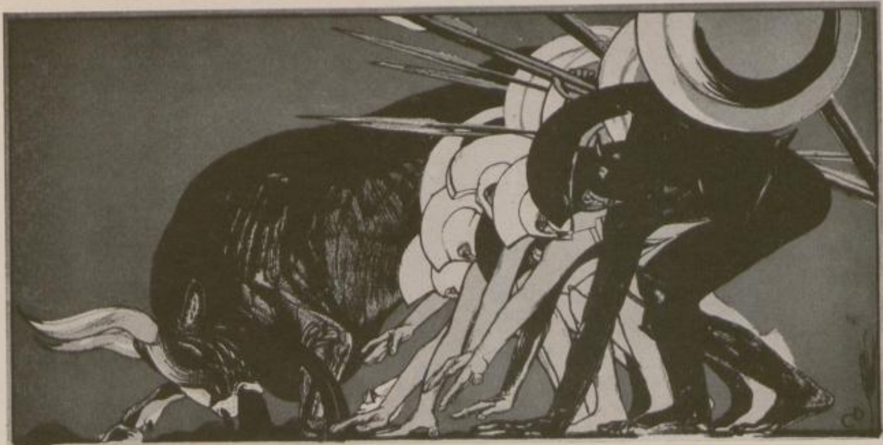
Teil eines Theaterplakates