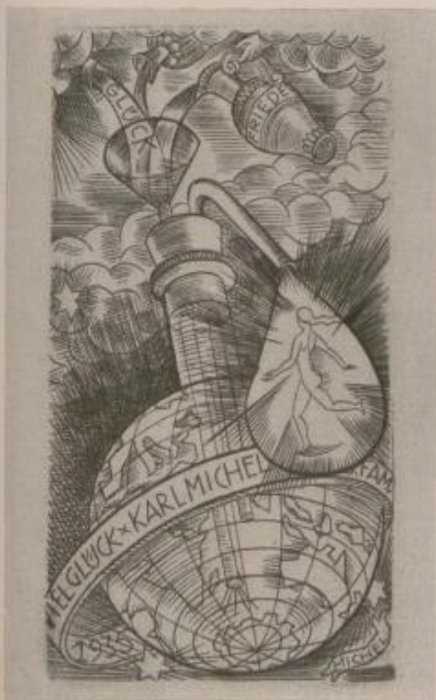
New year's cards

geachteten Namen gemacht. Er hat darüber aber als ein an allen technischen Problemen vielseitig interessierter Künstler niemals die anderen graphischen Verfahren, wie etwa den Kupferstich, vernachlässigt, den er schon in seinen Anfängen mit besonderer Liebe gepflegt hat und der nun seit einiger Zeit wieder in seinem Schaffen häufiger als zuvor in Erscheinung tritt. Er verwendet diese heute in Deutschland leider zu wenig ver-