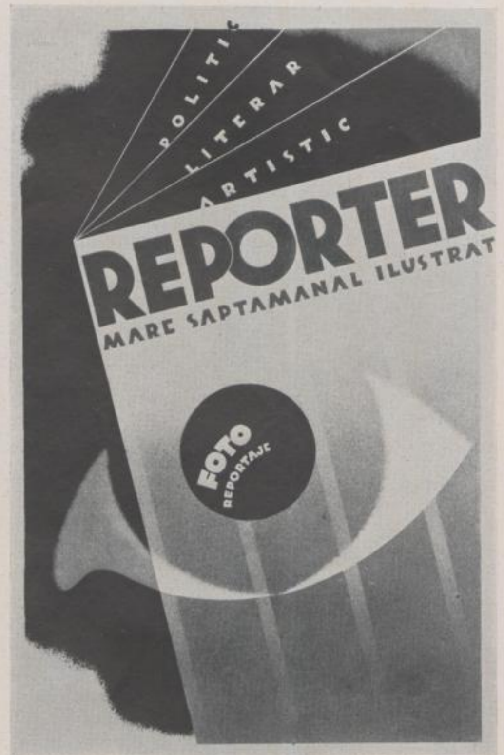
Poster for a Newspaper

für Ausstellungsdekorationen zu arbeiten. 1936 wurde er deshalb auch nach Berlin geschickt, um zur Zeit der Olympischen Spiele die Deutschlandausstellung zu sehen. Wie er selbst bekennt, war diese Studienreise für ihn richtungweisend. Immer mehr wurde er nun seinen graphischen Arbeiten untreu, um sich ganz den Ausstellungsbauten zu widmen. Wie die Abbildungen zeigen, macht er seine Sache modern und gut. Das Bemerkenswerte an diesen Pavillon-Ausstattungen und Wandaufteilungen ist vor allem, daß sie Klarheit zeigen. Wie im Plakatentwurf sieht er auch hier die Vollendung einer Idee nicht im