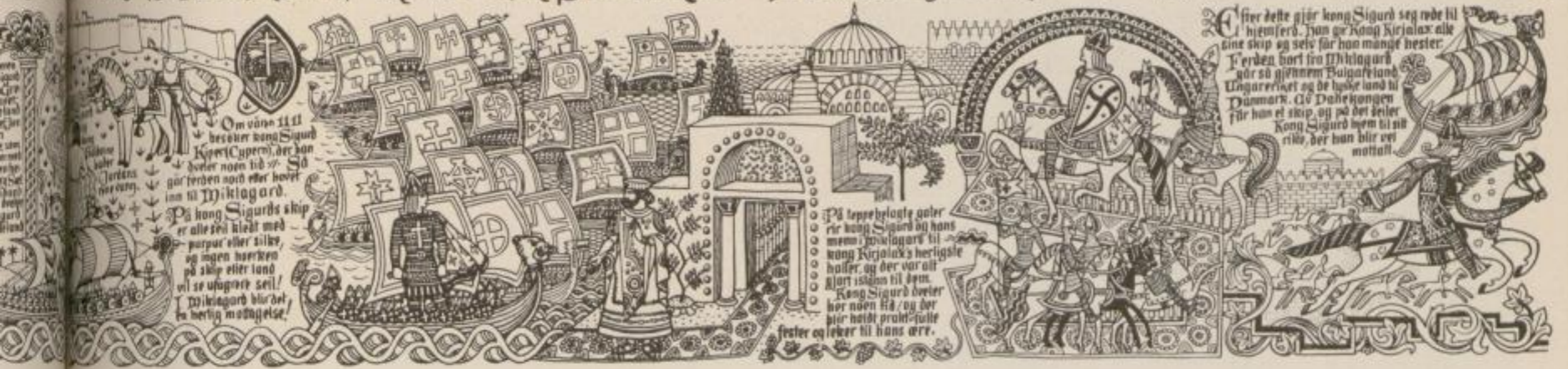
Frieze for the Exhibition "Nordmanno Folket" Oslo