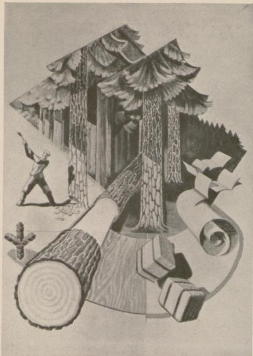
Wandgemälde aus dem norwegischen Pavillon auf der Weltausstellung New York Mural Paintings from the Norwegian Pavilion at the World Exhibition New York