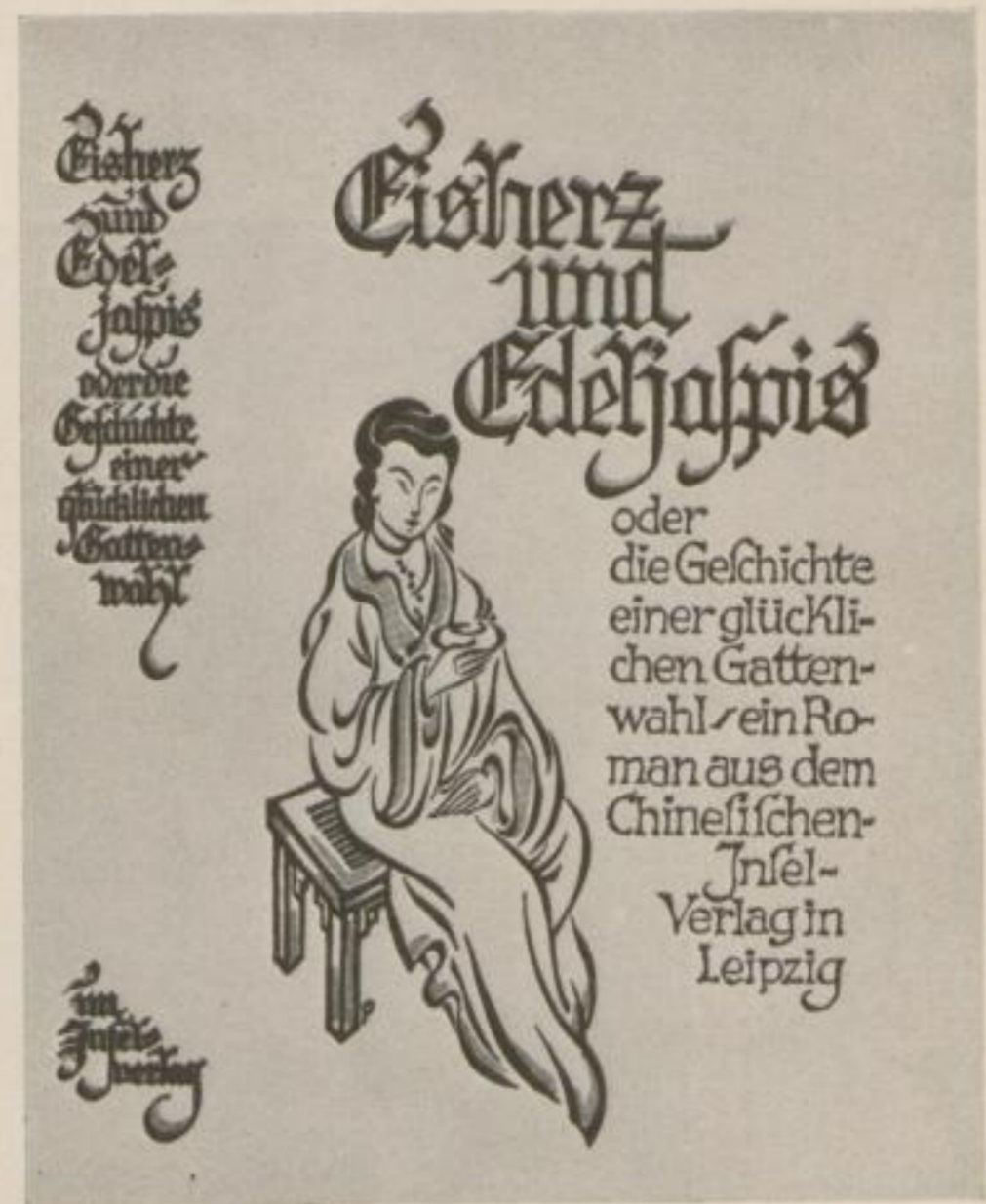
Book bindings and covers for the Insel-Verlag

und Form sich suchend begegnen und finden. Er hat den Instinkt für das Empfundene im Sachlichen, für das Pathos des Exakten; von ihm aus geht er den Weg zu seiner Erfüllung der Fläche wie des Raums, der Arbeit