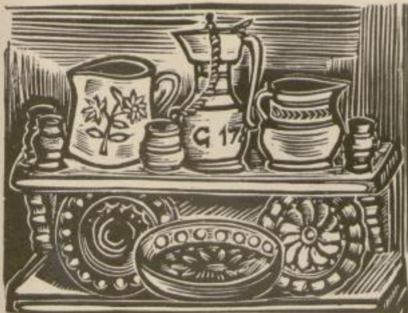
Buchillustration Book illustration