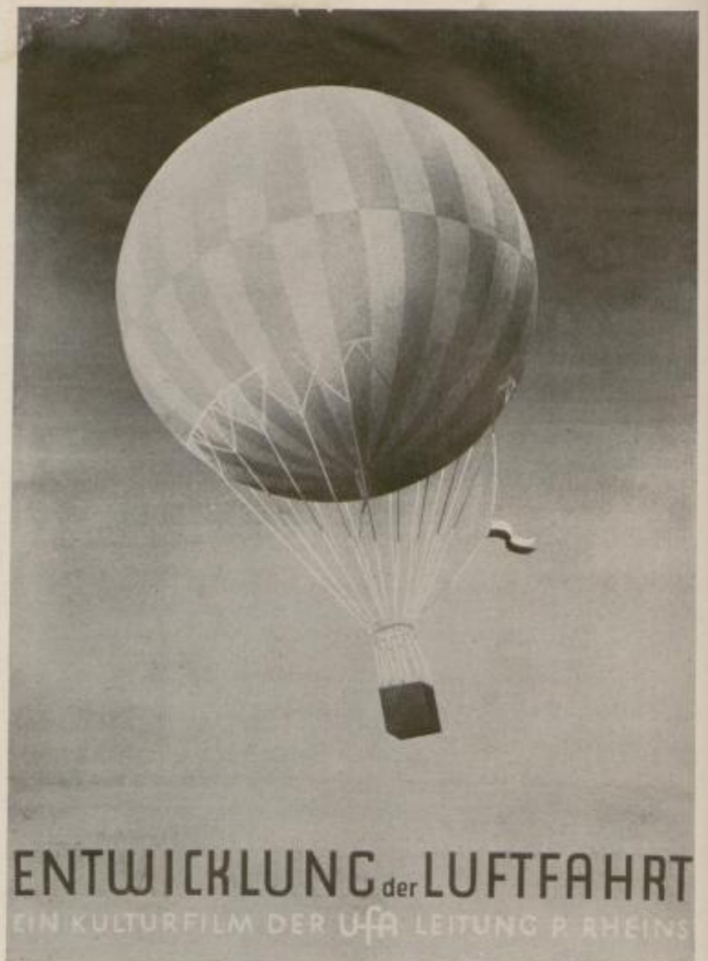
STUDIERENDE RÜTH VON CARNAP