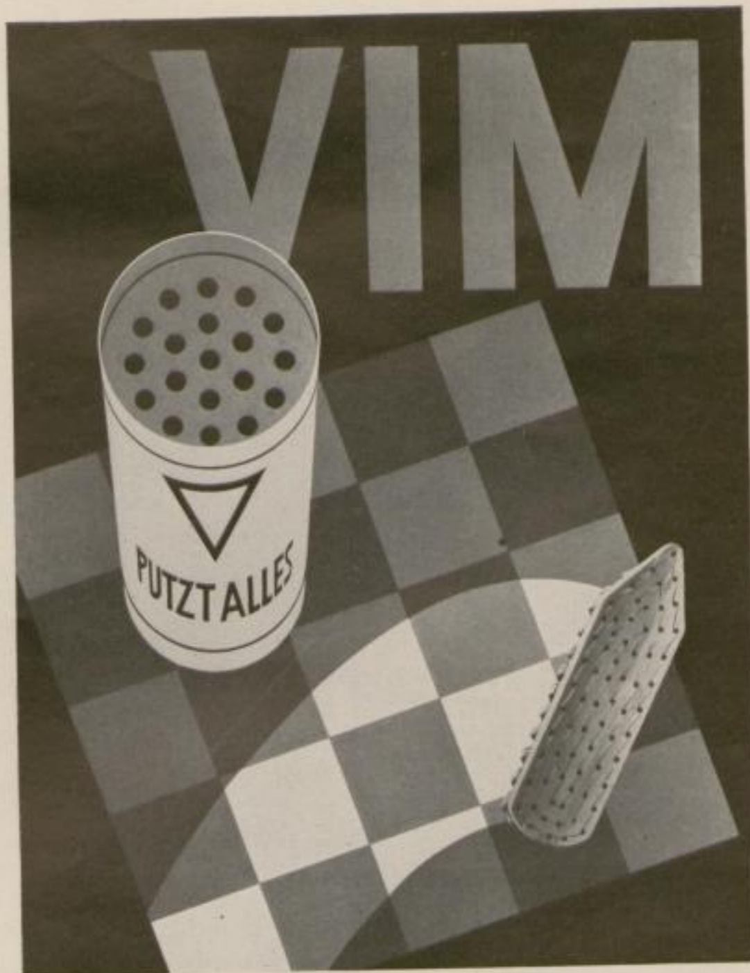
STUDIERENDE ILSE HUMMEL