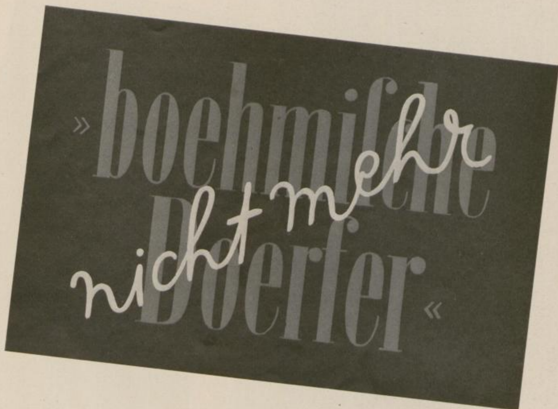
Titles of Pamphlets