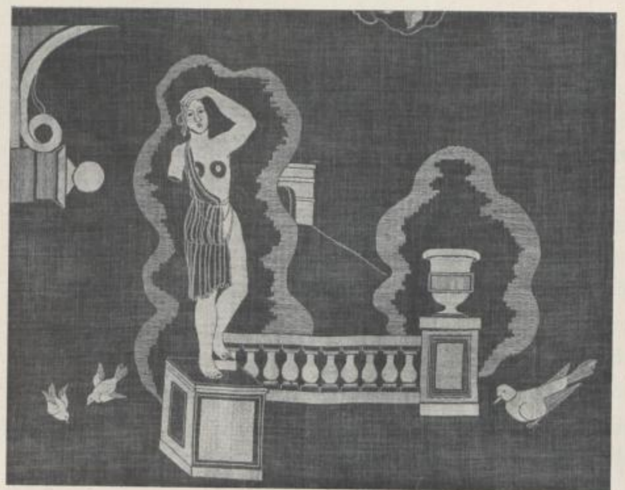
Teilstück aus der Decke „Paris“ Detail of hanging "Paris"