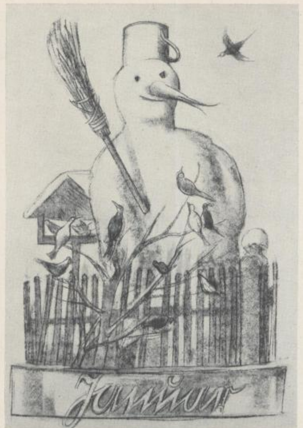
Zeichnungen für Wandbilder in einem Berliner Kinderheim der Reichspost