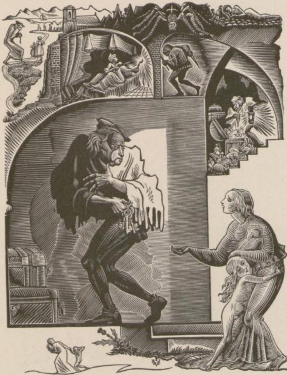
Der Geiz Avarice