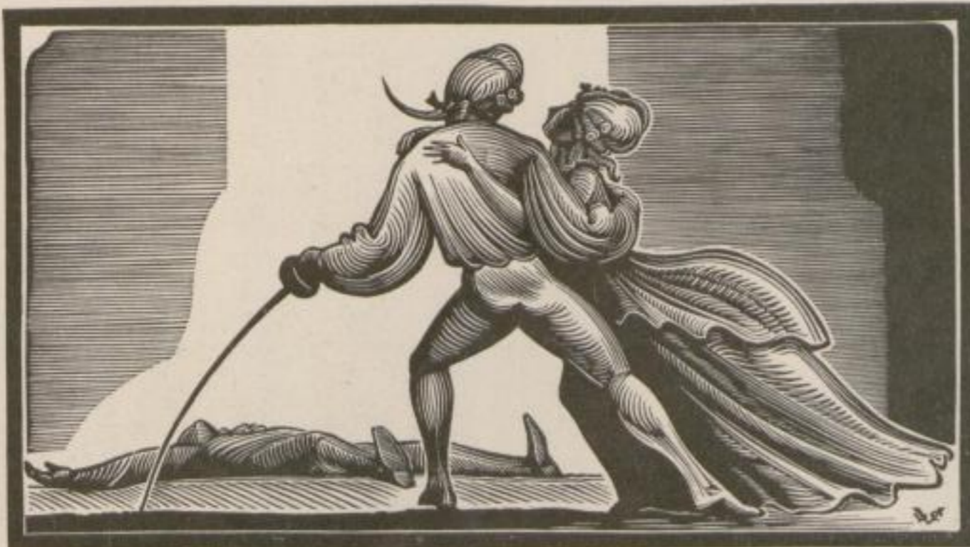
Illustrationen zu „Casanova“