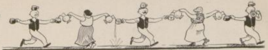
Ein langsame Schleifer im 'Dreiviertel'-Takt