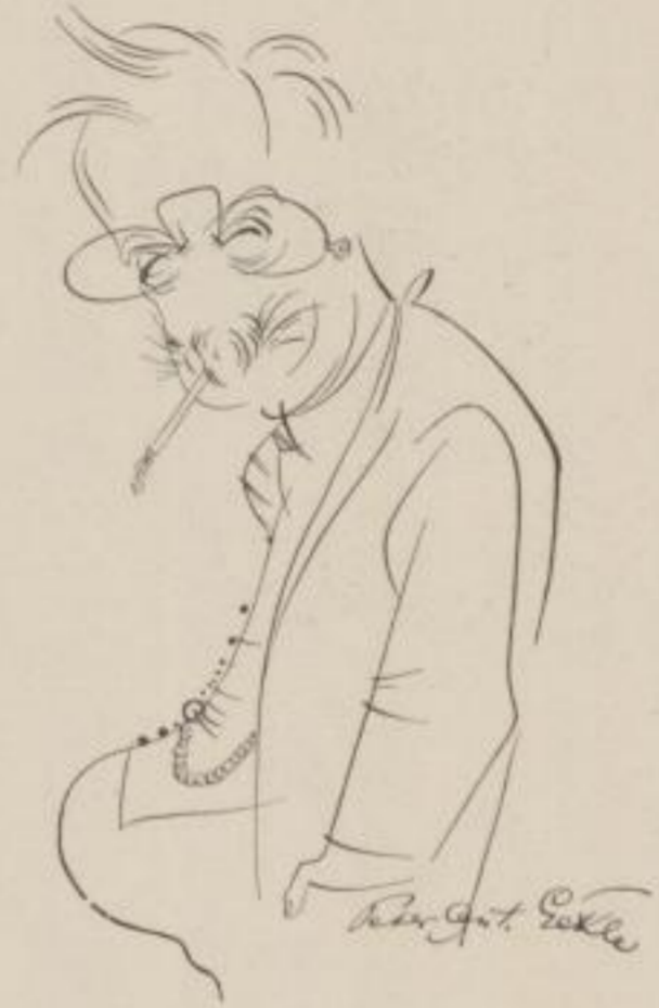
Der Dichter P. E.