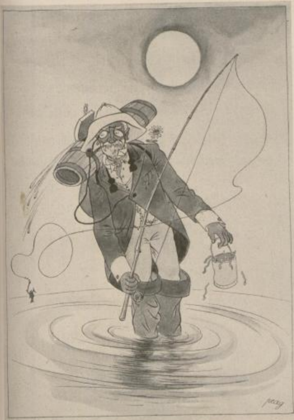
„Der Sportangler“ / Getuschte Federzeichnung