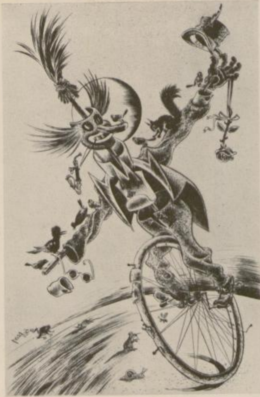
„Lumpazi Vagabundus“ / Originalradierung