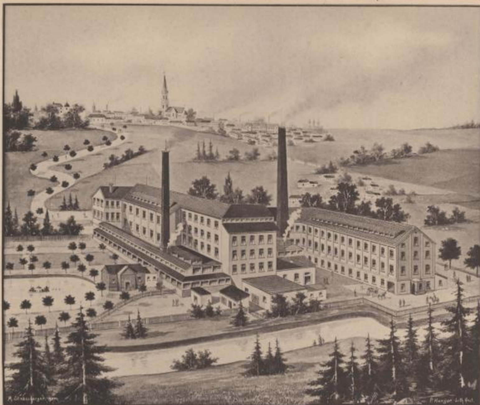
Bleicherei, Färberei und Appreturanstalt.